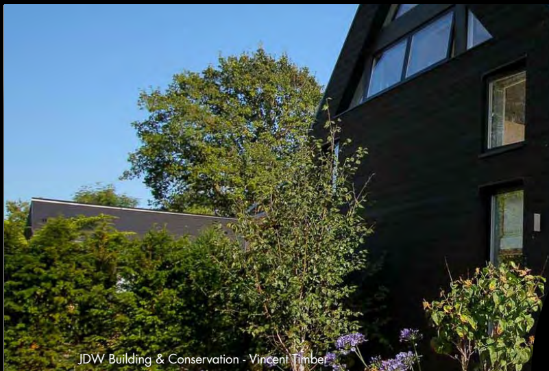
JDW Building & Conservation - Vincent Timbel