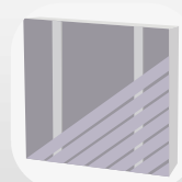
Pose diagonale simple lambourrage