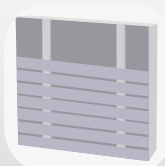
Pose horizontale simple lambourrage

(toutes pointes exceptionnellement fixées en pleine face visible devront être protégées par l'application d'un gel ou d'une finition assurant l'étanchéité du film de lasure) Traiter les coupes par l'application d'un gel ou d'une finition assurant l'étanchéité du film de lasure appliqué au niveau du bout des lames.