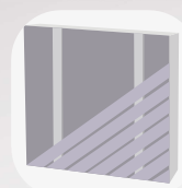
Pose diagonale simple lambourrage