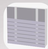
Pose horizontale simple lambourrage

6. Utilisez uniquement des pointes inox pour la fixation de votre bardage. Veillez à bien protéger les points de fixation et à traiter les coupes. Pour les lames dont la largeur est supérieure à 125 mm, elles doivent être fixées avec deux pointes dans la largeur.