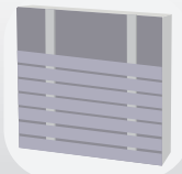
Pose horizontale simple lambourde

pour les ventilations basses et hautes. 5. La première lame devra être fixée à 20 cm minimum du sol fini extérieur (à 80 cm minimum de toute zone de végétation). Les languettes devront toujours être orientées vers le haut. 6. Utilisez uniquement des pointes inox pour la fixation de votre bardage. Veillez à bien protéger les points de fixation et à traiter les coupes. Pour les lames dont la largeur est supérieure à 125 mm, elles doivent être fixées avec deux pointes dans la largeur.