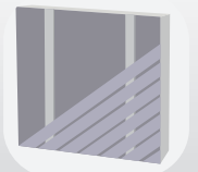
Pose diagonale simple lambourde